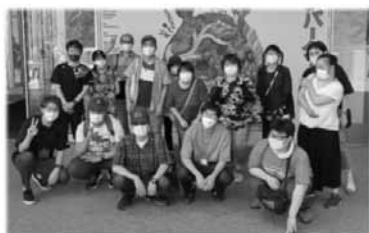
土曜開所・おでかけ